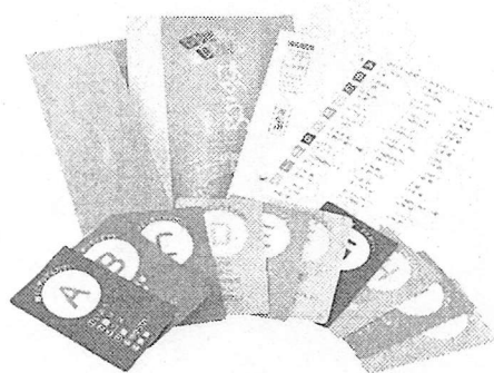
簡易キット「もの忘れアルかなチェック はからめ」

名古屋市のバイオ製品製造業「グローバルエンジニアリング」が、カードをこすり、においをどう感じたかで認知症の疑いを調べることができる簡易キット「もの忘れアルかなチェック はからめ」を販売している。同社の担当者は「いきなり病院に行くのはハードルが高いという声が多い。早期発見のきっかけになれば」とPRしている。同社によると、認知症の