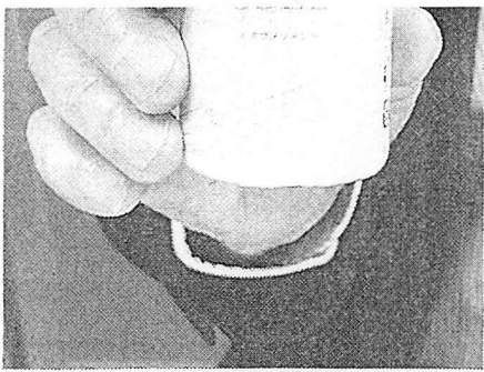
「水素フラチナゴールド」

「もみねこ」は、「ももちゃん」は、肩のこりをほぐしたくらはぎや足裏をマシできるグッズ。猫シテいて棚の上などけるため、使用しな部屋インテリアと活用できる。黒色が「くろちゃ