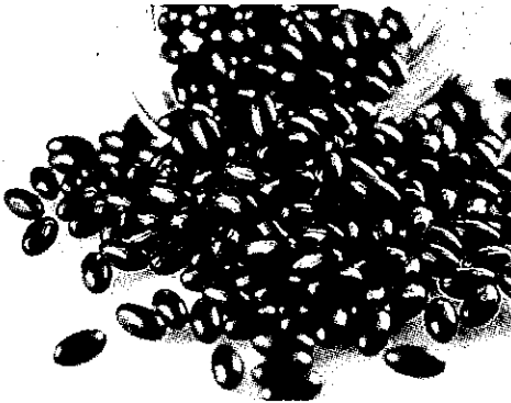
ブルーベリーからTie 2活性化物質を抽出。毛細血管の働きを活性化にするサプリメントとして展開する

ニンは抗酸化力に、キナ酸の一つカフェオイルキナ酸(タロロゲン酸類)はアルツハイマー病の予防や脂肪蓄積を抑える効果が期待されるとい